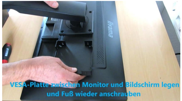
VESA-Platte zwischen Monitor und Bildschirm legen und Fuß wieder anschrauben