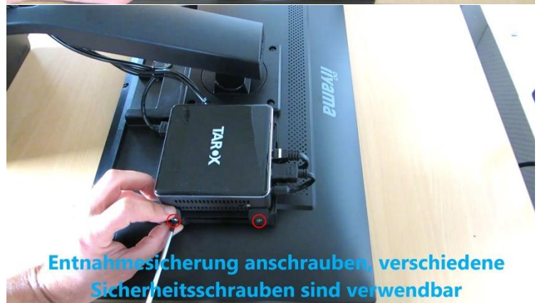
Entnahmesicherung anschrauben, verschiedene Sicherheitsschrauben sind verwendbar