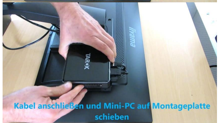
Kabel anschließen und Mini-PC auf Montageplatte schieben