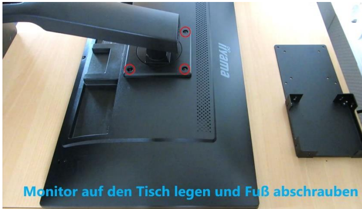
Monitor auf den Tisch legen und Fuß abschrauben