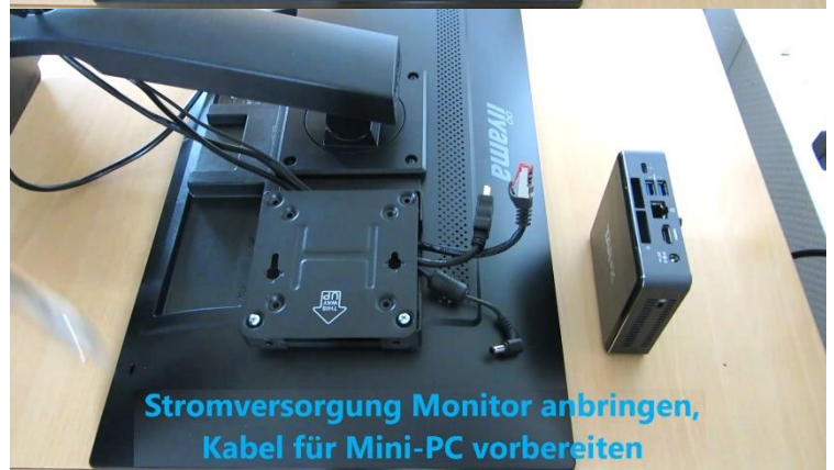
Stromversorgung Monitor anbringen, Kabel für Mini-PC vorbereiten