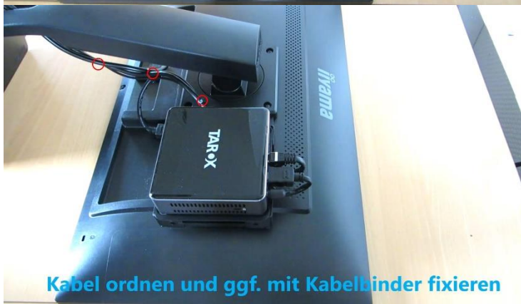
Kabel ordnen und ggf. mit Kabelbinder fixieren