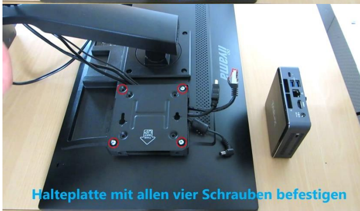
Halteplatte mit allen vier Schrauben befestigen