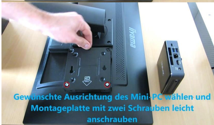
Gewünschte Ausrichtung des Mini-PC wählen und Montageplatte mit zwei Schrauben leicht anschrauben